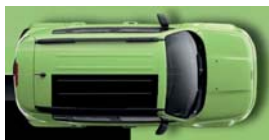
566 Zielony Hyper (metalizowany)