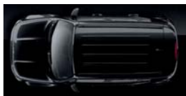
876 Czarny Carbon (metalizowany)