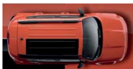
562 Pomarańczowy Omaha (pastelowy)