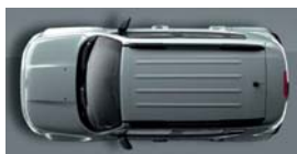
348 Srebrny Glacier (metalizowany)