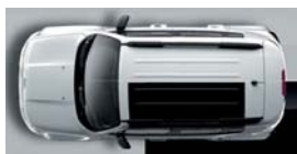
296 Biały Alpine (pastelowy)