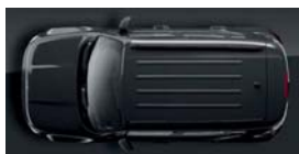
095 Grafitowy Granite Crystal (metalizowany)