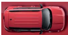
176 Czerwony Colorado (pastelowy)