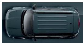
385 Szary Anvil (pastelowy)