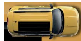
178 Żółty Solar (pastelowy)