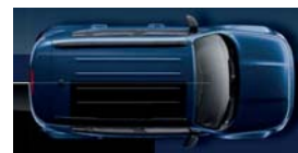
888 Niebieski Jetset (metalizowany)