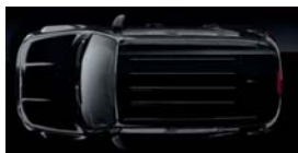
601 Czarny Solid (pastelowy)