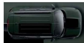
149 Zielony (matowy)